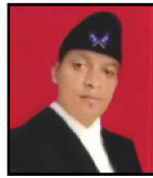
ज्ञान परियार गाउँ कार्यपालिका सदस्य