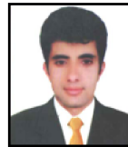
नरेनुदुर भट्ट वडा सदसुय वडा नं. ॡ ॡॡॡॡॡॡॡॡॡॡॡ