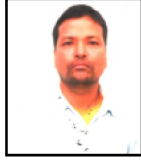
उत्तर बहादुर आले वडा सदसुय वडा नं. १ ॡॡॡॡॡॡॡॡॡॡॡ