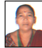
धन माया वलक. दललत महलला सदसुय वडा नं. ३ ॡॡॡॡॡॡॡॡॡॡॡ