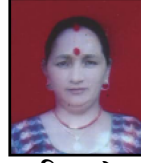
सबलना श्रेष्ठ महलला सदसुय वडा नं. १ ॡॡॡॡॡॡॡॡॡॡॡ