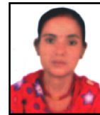
पंफा दुवाडी महलला सदसुय वडा नं. ॡ ॡॡॡॡॡॡॡॡॡॡॡ