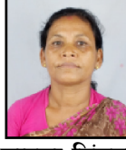
जानुका सलखडा गाउँपालिका उप-प्रढुख ॡॡॡॡॡॡॡॡॡॡॡ