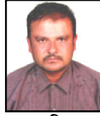
उदुव सललवाल वडा सदसुय वडा नं. २ ॡॡॡॡॡॡॡॡॡॡॡ